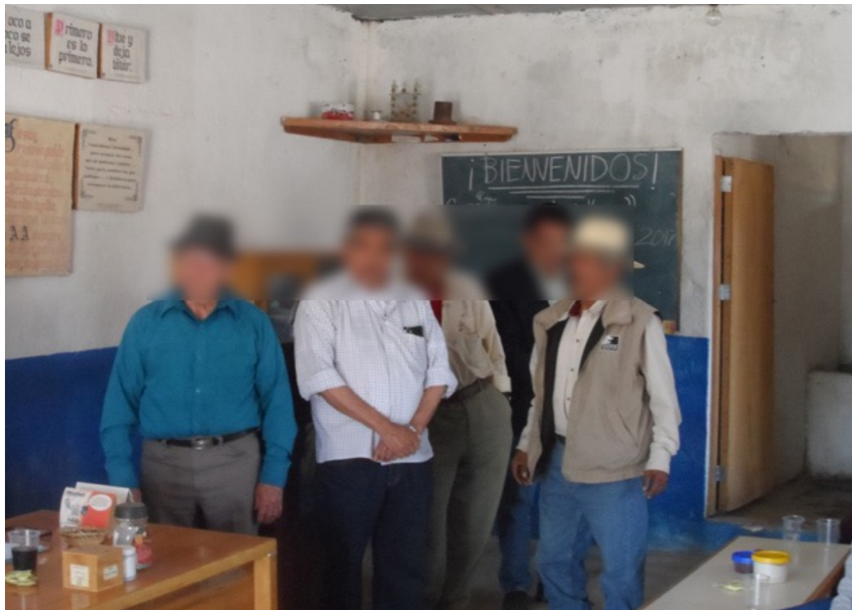
Primera Reunión de Veteranos celebrada el 17 de febrero de 2017 en el Grupo «Empezando a Vivir» en la comunidad de Puente de las Vigas, Guanajuato, Gto.